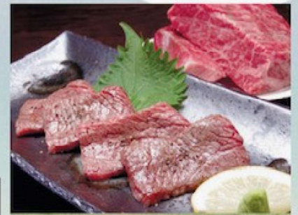
能登牛炙り焼き 1,800円 Grilled Noto Beef