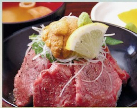
能登牛炙り井 2,800円 Noto Beef and Sea urchin rice bowl ご飯少なめです