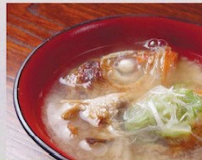
のど黒の頭のあら汁 500円 Soup made from the Bony Parts of Rosy Seabass (Fish) 300円で井、定食の味噌汁と交換できます。