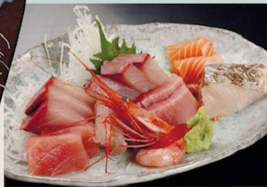
刺身盛り合わせ(1人前) 1,800円 Assortment of raw fish