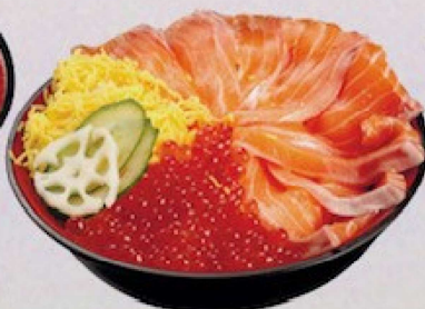
サーモン・いくら丼 2,500円