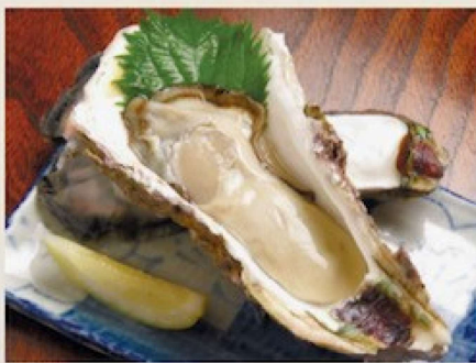
岩ガキ 1,300円(夏季限定) 生ガキ 1,000円 Oyster