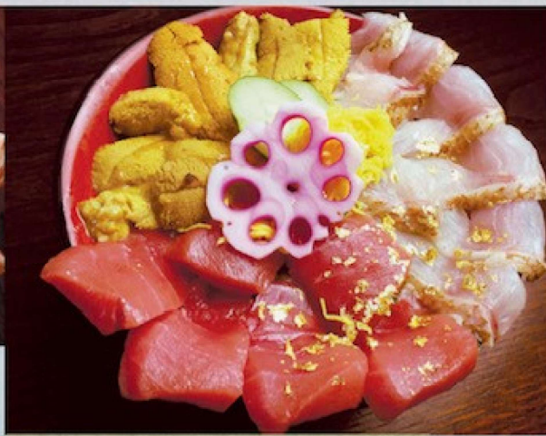
贅沢三味井 4,000円 Lavishness rice bowl 中トロ、うに、のど黒の井です Medium-fatty-tuna and Sea urchin and Rosy Seabass rice bowl