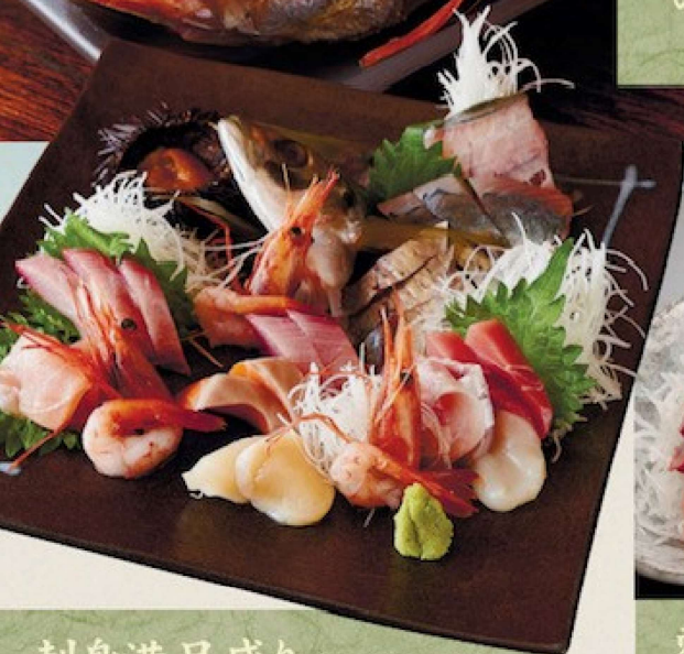
刺身満足盛り(のど黒入り) (2~3人前) 3,500円 Assortment of raw fish