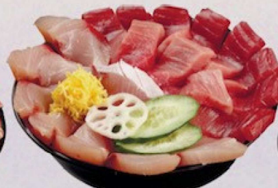
ぶり・まぐろ丼 3,000円

※冬以外はぶりーはまちになります Yellowtail and Tuna rice bowl (Winter season limitation)