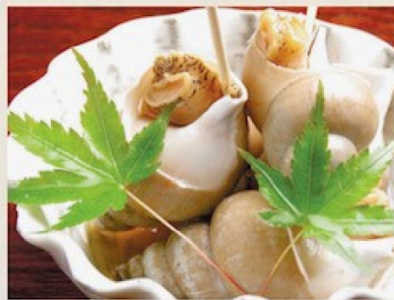
ばい貝煮 700円 Simmered Japanese Ivory Shell in Sweetened Soy Sauce