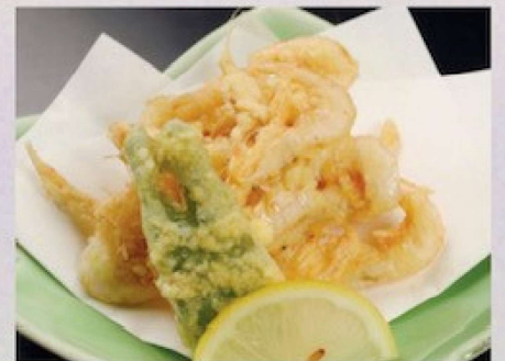
白海老唐揚げ 800円 Fried White Shrimp