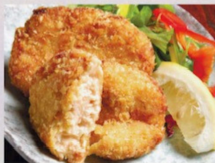
かにと海老の クリームコロッケ 800円 Crab and Shrimp Cream Croquettes