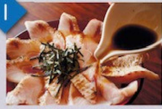
わさび醤油で、まずはのど黒井として! Please try this first with soy sauce and wasabi