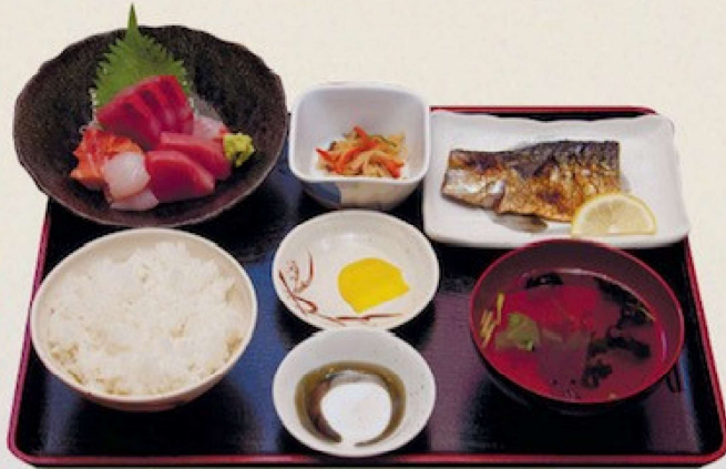
おまかせ定食 1,500円 Entrust set meal