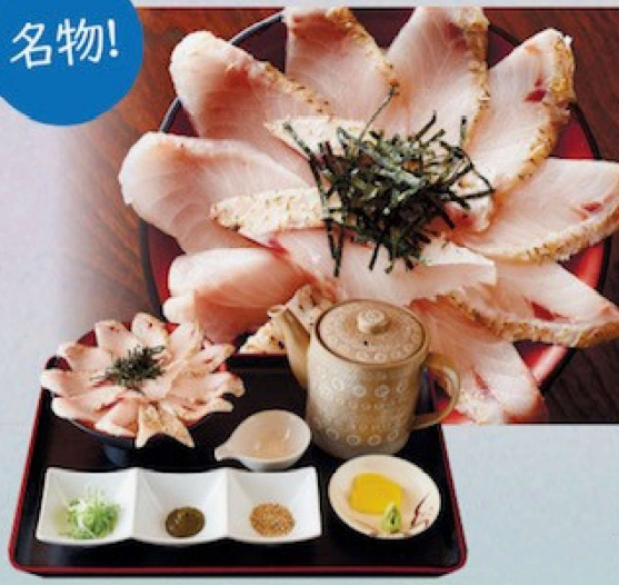
のど黒めし 3,900円 Rosy Seabass rice with soup stock