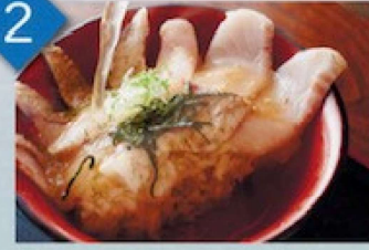
薬味を入れて、のど黒の出汁でめる! Ask our staff/us when you have the last few pieces of sashimi. We will pour hot soup to the bowl.