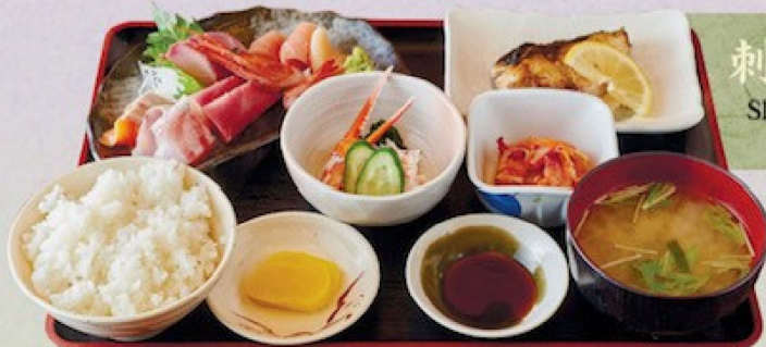
刺身屋定食 2,000円 Slices of raw fish shop set meal (Sashimiya set meal)