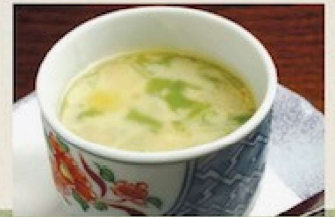
海鮮茶碗蒸し 600円 Savory Steamed Custard in Individual Cups