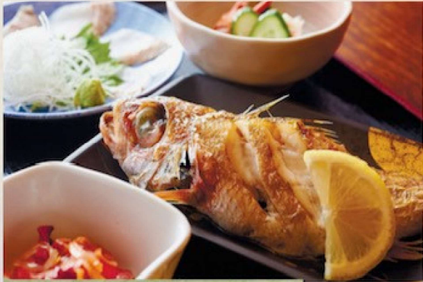
のど黒定食 3,700円 Rosy Seabass set meal

井以外にも、地元の人気定食メニューをご用意。中でも、のど黒を堪能できる。のど黒定食は当店のおすすめ。新鮮な定食メニューをお楽しみください。