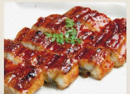
うなぎの蒲焼き 2,300円 Grilled Eel Fillets with a Sweetened Soy-sauce