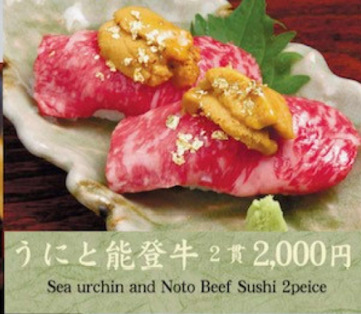
うにと能登牛 2貫 2,000円 Sea urchin and Noto Beef Sushi 2piece